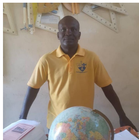
Enseignant de formation

Marié, père de famille de cinq enfants, il se dévoue entièrement à la gestion de l'école et des différents projets réalisés par l'ASAH.