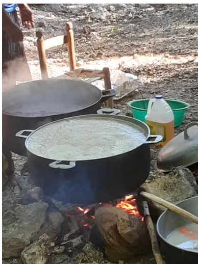
Cuisson au feu de bois

La cantine scolaire permet de nourrir 240 élèves trois fois par semaine, qui apprécient grandement les mets offerts. De leur côté, les enseignants ont noté un changement significatif chez ces élèves, car ils sont plus attentifs et plus motivés. Leur motivation a des répercussions positives sur leur rendement scolaire.