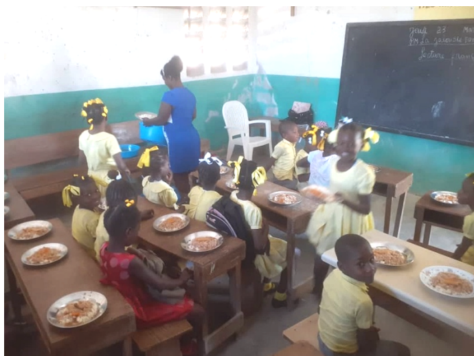
Un précieux repas, servi dans la classe.