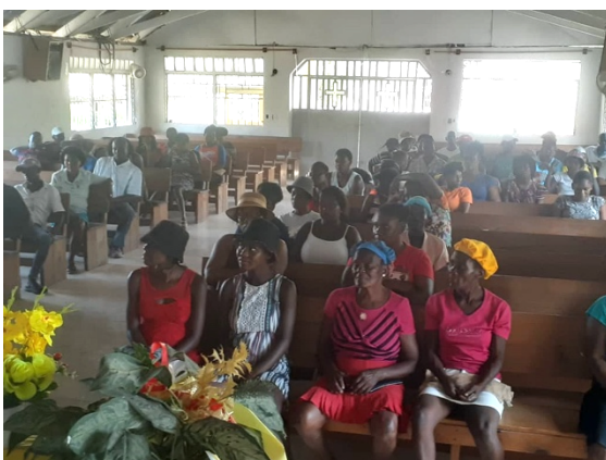
Séance avec les parents des élèves de l'école de Banique concernant le microcrédit

Un impact positif du projet est que les familles arrivent à payer les frais de scolarité de leurs enfants. Elles ont le sentiment d'avoir retrouvé leur dignité comme l'a témoigné une des bénéficiaires : «Avant, j'avais honte parce que je ne pouvais pas nourrir mes enfants et les envoyer à l'école. Maintenant, je me sens fière, car je peux assumer mes responsabilités envers eux. » Les familles tiennent à remercier les donateurs et le comité de L'ASAH de leur générosité.