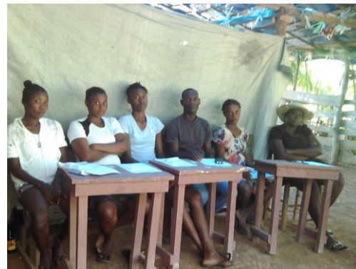
Participation aux réunions pour le microcrédit

Notre projet a débuté en septembre 2021 : 43 familles et 10 enseignant-e-s ont bénéficié d'un microcrédit de 25'000 gourdes (l'équivalent de 250.- CHF) à rembourser après une durée de 10 mois avec un intérêt de 5%.