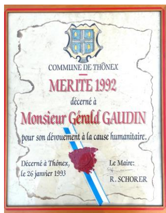
Le mérite décerné à feu notre président de l'ASAH, résident de Thônex