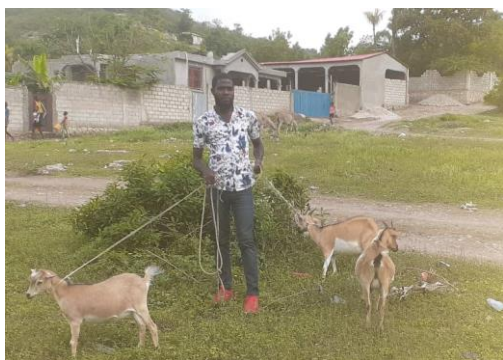
Microcrédit accordé pour l'achat et l'élevage de chèvres

En août 2022, le remboursement du prêt par 50 personnes a permis de proposer un microcrédit à 49 autres personnes en une année. Nous avons ainsi doublé le nombre de bénéficiaires !