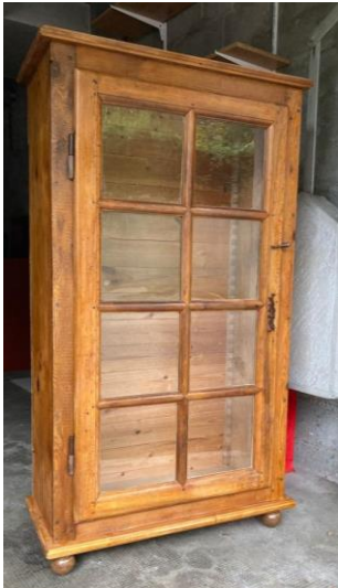
Vitrine avec fenêtre de la rue de l'Hôtel-de-Ville de Genève

A mentionner aussi une vitrine faite avec probablement l'une des plus vieilles fenêtres de Genève, provenant d'un grenier du 24 rue de l'Hôtel-de-Ville. Elle a été achetée par une jeune du village de Jussy ; mais comme elle habite Bulle, nous la lui avons livrée ! Il nous reste une deuxième fenêtre identique, si jamais vous désirez un meuble réalisé sur mesure... faites-le moi savoir !