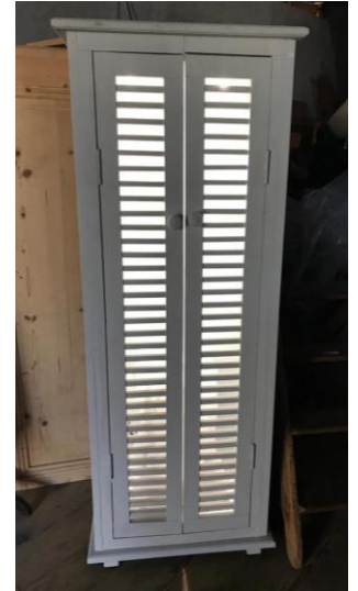
Nouvelle création ! Dimensions H 140 x L 54 x Prof. 32 cm

Parmi les nouvelles créations, il y a cette vitrine faite avec deux claies de dessus de radiateur du début du 20 e siècle, dont les rayons en verres sont éclairés par trois ampoules LED installées par Raphaël.